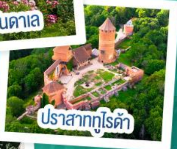
ปราสาทกูไรต้า