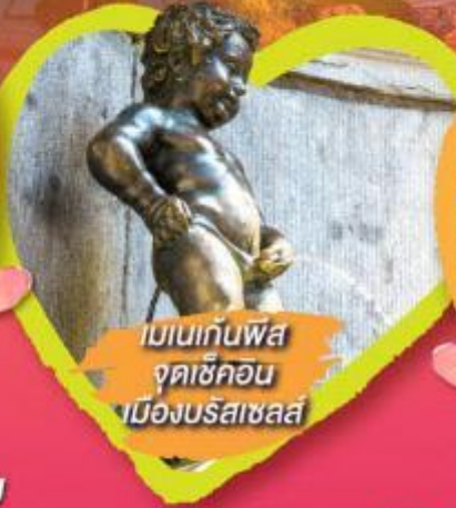
เมเนกันฟัส จุดช็อคคอน เมืองบรัสเซลส์