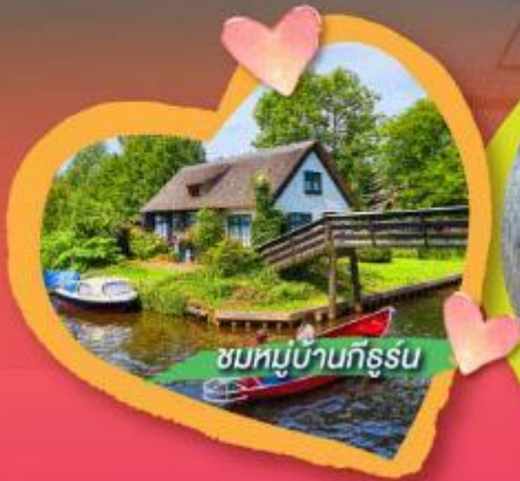
ชมหมู่บ้านกังหัน