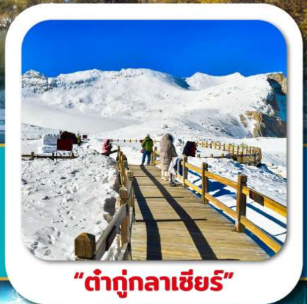
"ต่ากู่กลาเซียร์"

เที่ยวชมความงาม 3 อุทยานชื่อดัง : สีดรุณี • ปี่เฟิงโกว ต่ากู่กลาเซียร์ ชมความน่ารักของหมีแพนด้า • จตุรัสหยางเทียนวู่ ชอยกว้างชอยแคบ • ถนนคนเดินซุนซีลู่ • POP MART