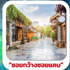
"ชอยกว้างชอยแคบ"