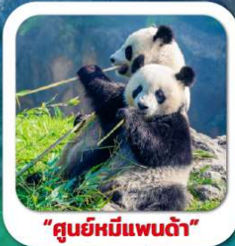
"ซุนยี่หมีแพนด้า"