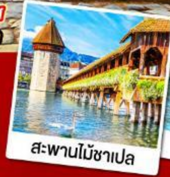
สะพานไม้ซาเปล