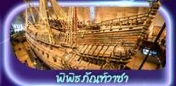
พิพิธภัณฑ์ทิวาซา