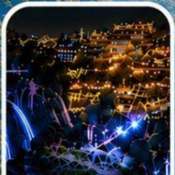
เมืองโบราณฝูหรงเจิ้น หมู่บ้านโบราณกลางหุบเขา