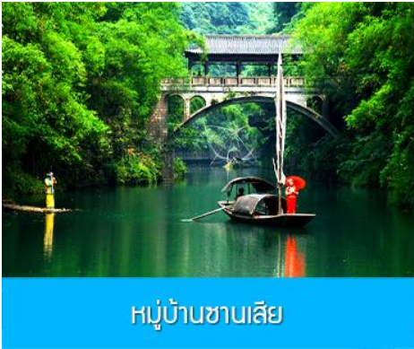
หมู่บ้านชาวลี

17.40 น. เดินทางถึง สนามบินนานาชาติ เมืองหยี่ชาง ผ่านพิธีการตรวจคนเข้าเมืองและศุลกากร นำคณะเดินทางสู่โรงแรมที่พักในเมืองหยี่ชาง พักที่ YICHANG HUIHAO HOTEL โรงแรมระดับ 4 ดาวหรือเทียบเท่าในเมืองหยี่ชาง