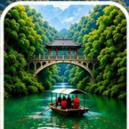
ลำธารหลงจินซี ชมธรรมชาติสุดอลังการ

ชมความงามมุมพิเศษ บุฟเฟ่ต์หมูย่างเกาหลีสุดฟิน