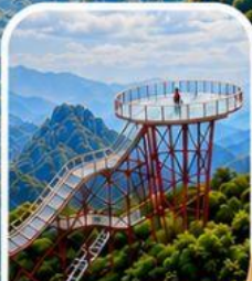
เข่าเจ็ดดาว จุดชมวิวดูหवादเสีฮว