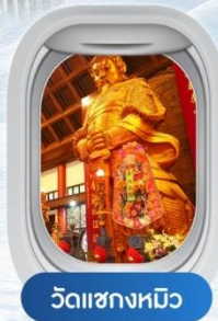
วัดเชงหมิว