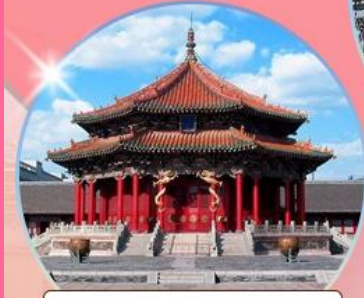
พระราชวังกู้กง เส้นหยาง