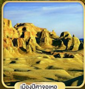
เมืองปีศาจอุเทอ