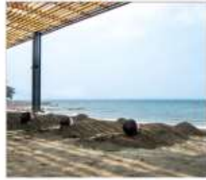
อามทรายร้อย