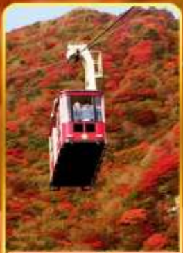
กระเช้าลอยฟ้าอุเซน