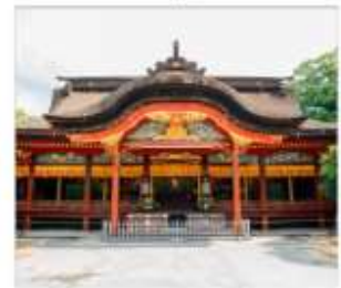
ศาลเจ้าดาไซฟู