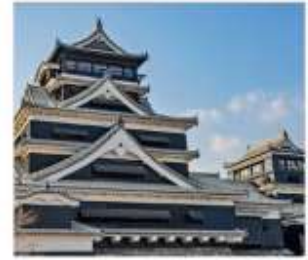
ปราสาทคามาโมตะ