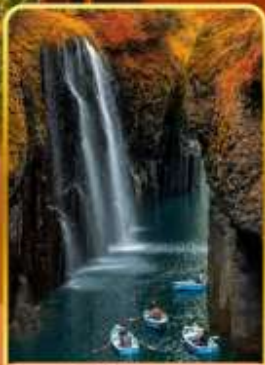
ทาคาจิโอะ(โปรแกรมสองเรือ)