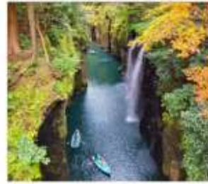
หุบเขาทาดางิโฮะ