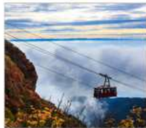
นั่งกระเช้าลอยฟ้าอุเนเซ็น