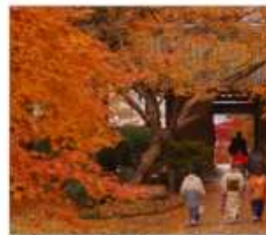
วัดไดโดเซนจิ