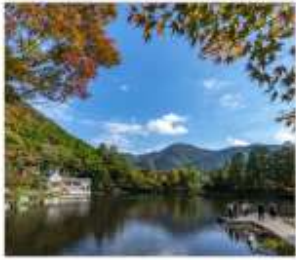
ยูฟูจิน (ทะเลสาบคีริน)