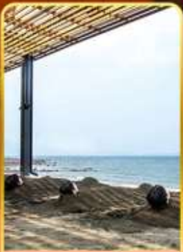
อาบน้ำร้อน