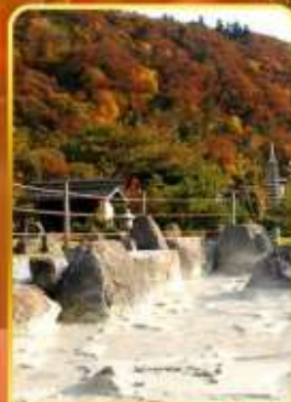
หุบเขานรกอุเซน