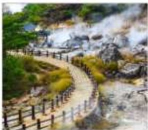
หุบเขานรกอุเนเซ็น