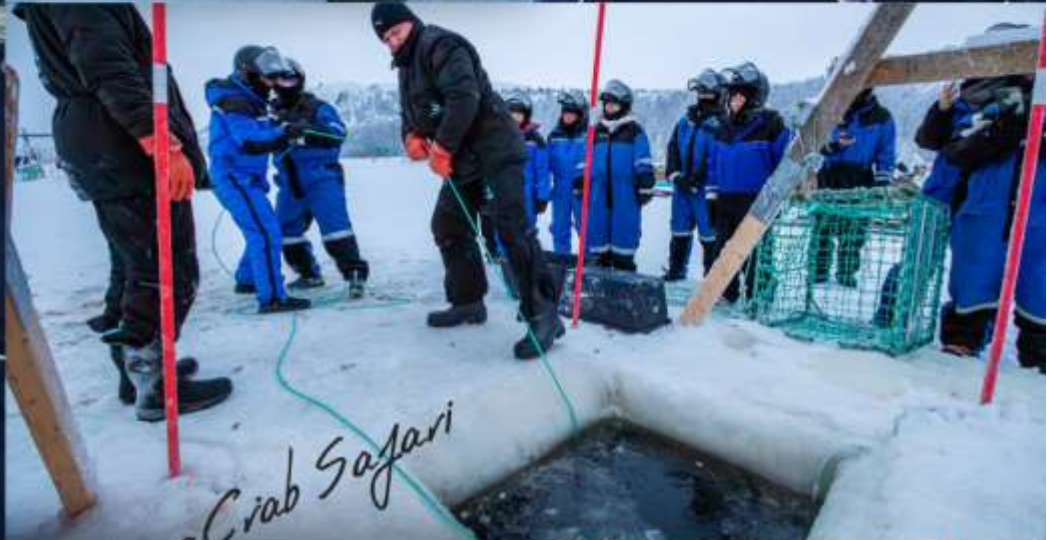
King Crab Safari