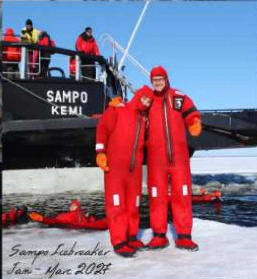
Sampo Icebreaker Jan - Mar 2027