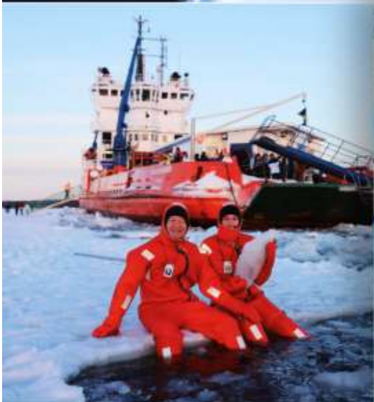
Polar Icebreaker Apr 2027