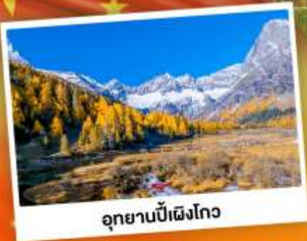
อุทยานปี้ฝิงโกว