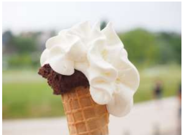
ภาพประกอบเท่านั้น