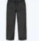
พร้อมกางเกงขายาว