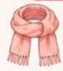
ผ้าพันคอผืนบาง