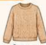
เสื้อไหมพรม