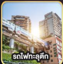
รถไฟฟ้าชุนชิ่ง