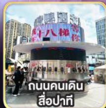
ถนนคนเดิน สือปาตี