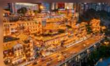
หงหย่าตั้ง