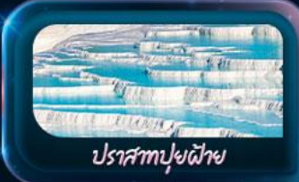
ปราสาทฟูยไฟย