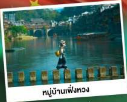
หมู่บ้านเฟิงหวง

สุดคุ้ม!! พัก 5 ดาว ทุกคืน มนต์เสน่ห์เมืองเก่า ริมสายน้ำแห่งขุนเขา