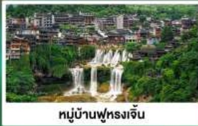
หมู่บ้านฟุหลงเจิน