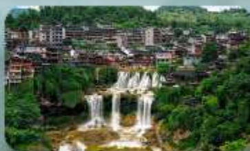
หมู่บ้านฟุทงเจิ้น