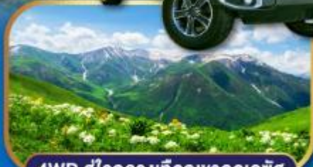
4WD สู่ใจกลางเทือกเขาคอเคซัส