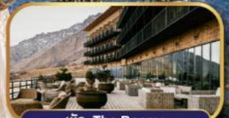
พนัก The Rooms