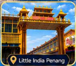
Little India Penang