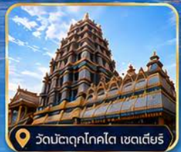
วัดมัตตุกโกโต เซดเตียร์