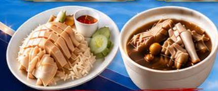
ข้าวมันไก่ปีนัง