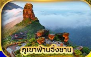
ภูเขาผานจิ่งชาน