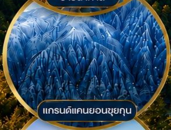
แกรนด์แคนยอนซุยกุณ