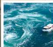
คลองเรือขมน้ำวนมารุโตะ

คลองเรือขมน้ำวนมารุโตะ / ซุปบึงย่านชินโซบาช / ตลาดปลาคุโรเมง / ซุปบึงย่านอุมาเดะ