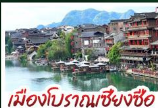
เมืองโบราณเซียงซือ