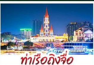
ท่าเรือกิ่งจื่อ

เขาชิงช้าสวนดอกไม้ตามฤดูกาล หมู่บ้านสไตล์ยุโรปเที่ยงยวี่ มังซิง เสี่ยวจั้น ถนนคนเดิน NANNING ZHIYE - เมืองโบราณไถ่ผิง ท่าเรือกิ่งจื่อ - ถนนคนเดิน สามตรอกสองซอย