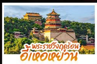
พระราชวังฤดูร้อน อี่เหอเฉยวัน