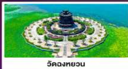
วิดงหววน