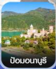
ป้อมอนาบุรี