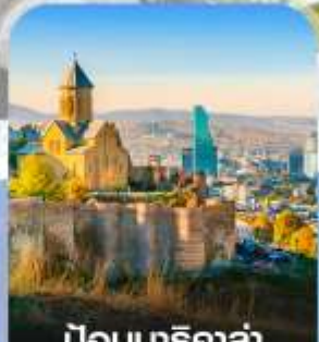
ป้อมนาริ کالا