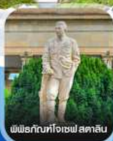
พิพิธภัณฑ์โจเซฟ สตาลิน