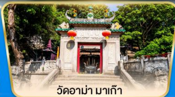
วัดอาม่า มาเก๊า