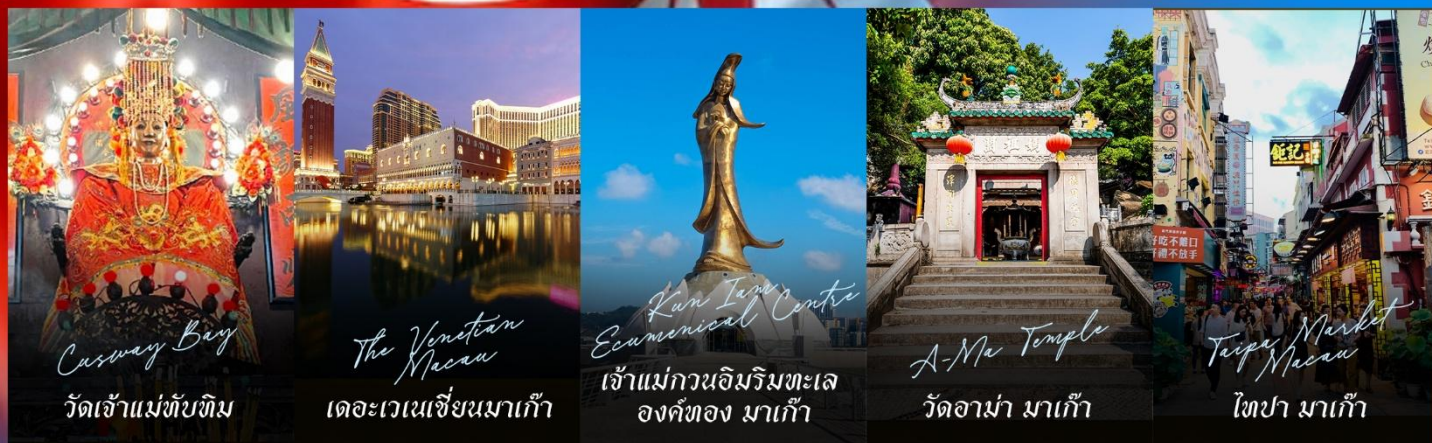
Casway Bay วัดเจ้าแม่ทับทิม

รายการทัวร์ข้างต้นอาจมีการปรับเปลี่ยนเพื่อความเหมาะสม