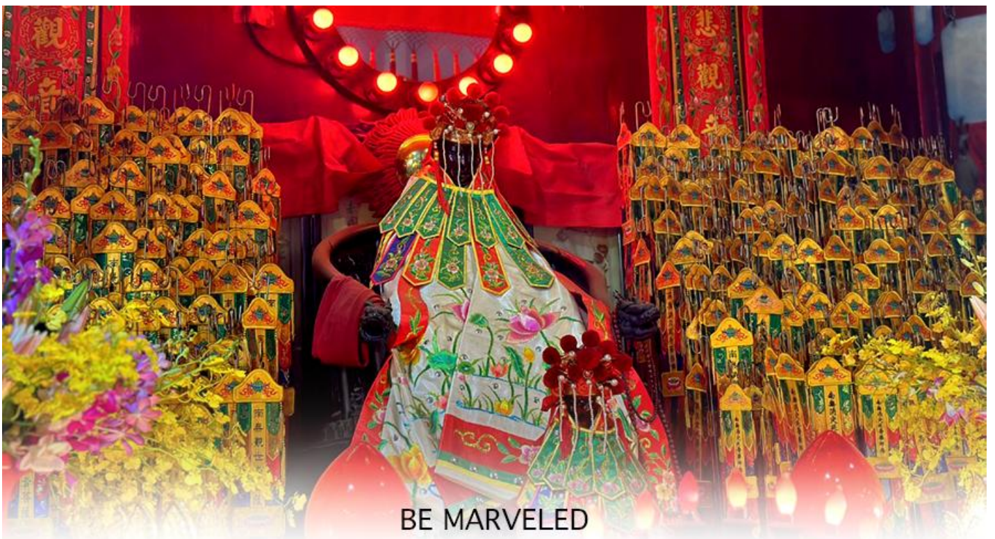
วัดเจ้าแม่กวนอิมฮวงอ้า (ฮิมเมิน)

ให้เดินทางกลับไปกราบไหว้ และขอบคุณเจ้าแม่กวนอิมอีกครั้ง โดยเตรียมชุดไหว้และกระดาษาเงินกระดาษาทองที่เป็นเหมือนเงินที่เรานำมาคืน เป็นการไหว้เพื่อคืนเงินเจ้าแม่กวนอิมนั่นเอง