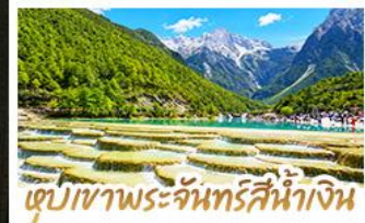
เขุบเขาพระจันทร์สีน้ำเงิน