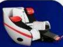
ที่นั่งพรีเมียมฟเลกซ์

บริการอาหารร้อน และ น้ำดื่ม บนเครื่อง ขาไป และ ขากลับ