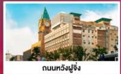
ถนนหวังฝูจิ่ง