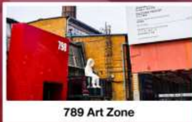
789 Art Zone