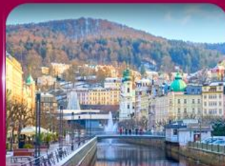
เมืองสปาแสนสวย คาร์ลวิ วารี