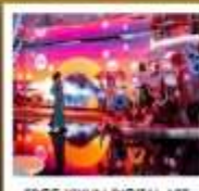
EDCC YIYUN DIGITAL ART