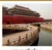
พระราชวังกรุงปักกิ่ง