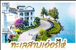
ทะเลสาบเอ๋อร์ไห่