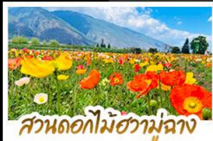
สวนดอกไม้ฮวามู่ฉาง