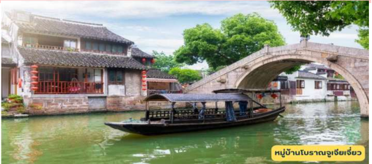
หมู่บ้านโบราณจูเจียเจี้ยว