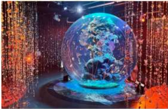
KOBE AQUARIUM ATOA