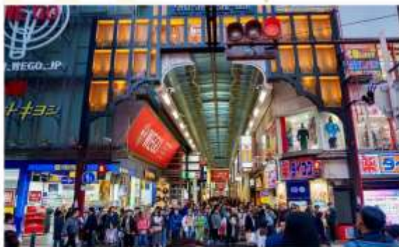
SHOPPING AT SHINSAIBASHI