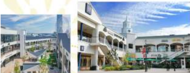
SHOPPING AT RINKU PREMIUM OUTLET

เดินทางสู่ย่านริงกุ จังหวัดโอซาก้า เพื่อช้อปปิ้งจุดที่ "ริงกุ พรีเมียม เอาท์เล็ต" แหล่งรวมสินค้าแบรนด์เนมชั้นนำระดับโลกในราคาลดพิเศษสุด คุ่ม อิสระให้ท่านเดินเพลิดเพลินกับการเลือกซื้อเสื้อผ้า กระเป๋า และรองเท้า คอลเลกชันโปรด ท่านกลางบรรยากาศอากาศที่เลิศสโรสรื่นรมย์ทะเลที่กว้างขวาง ให้ท่านได้บริหารเวลาในการช้อปปิ้งหรือแวะนั่งพักผ่อนตามคาเฟ่ชิวๆ ภายในพื้นที่ได้อย่างเต็มที่ตามไลฟ์สไตล์ของท่าน