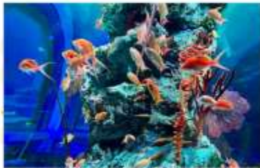
KOBE AQUARIUM ATOA