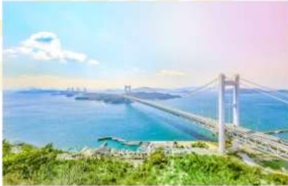
AKASHI KAIKYO BRIDGE & AWAJI HIGHWAY OASIS