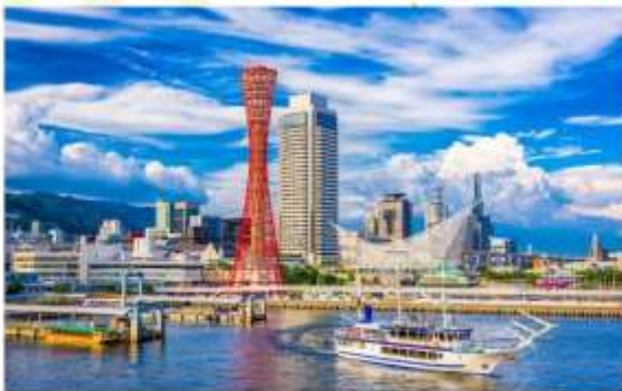
KOBE PORT TOWER