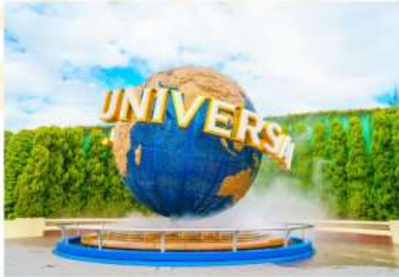
UNIVERSAL STUDIOS JAPAN