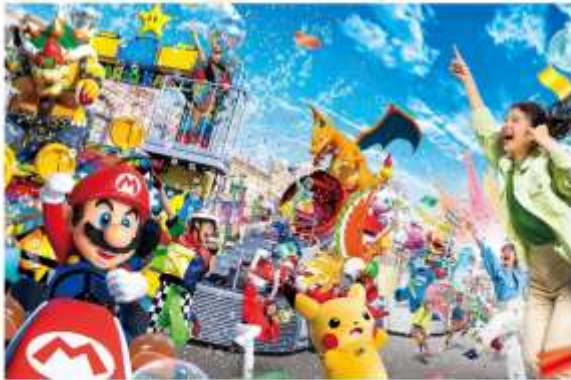
SUPER NINTENDO WORLD

นอกจากนี้ยังมีโซนยอดนิยมอื่นๆ เช่น Minion Park, Jurassic Park, Hollywood, New York และ Amity Village ที่พร้อมมอบความสนุกให้กับทุกคนในครอบครัว