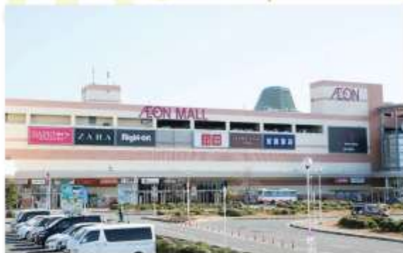
SHOPPING AT SENNAN AEON MALL