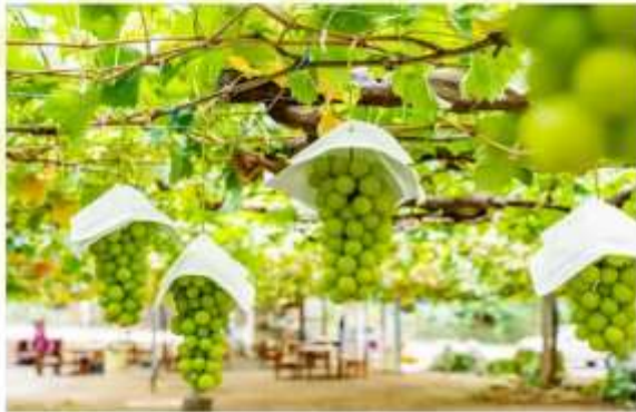
SHINE MUSCAT FARM AT KATSURAGI