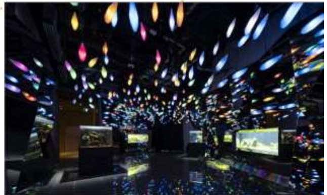
จับประทานอาหารกลางวัน ณ กิตตาคาร