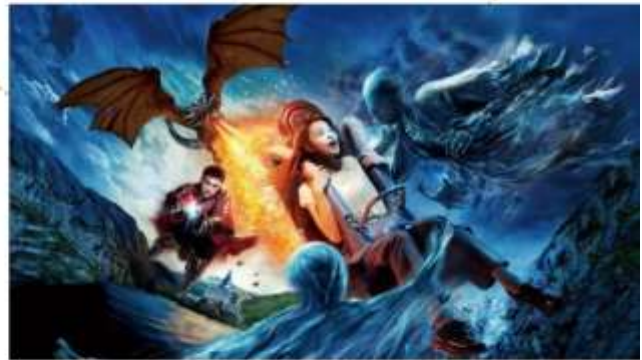
อิสระอาหารกลางวัน ตามอัธยาศัย (ไม่รวมในรายการ)