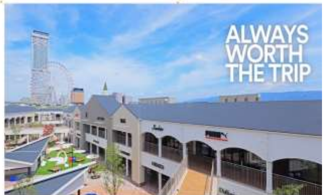
อิสระอาหารกลางวันตามอัธยาศัย (เงินคืนจากบัตรเครดิต 2,000 เยน)