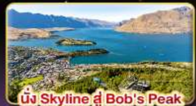
นั่ง Skyline ที่ Bob's Peak