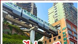
รถไฟทะลุคด