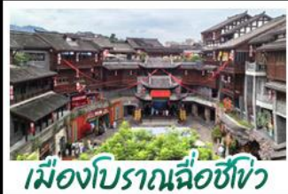
เมืองโบราณฉือซีโขง

อุทยานสีครุณี - อุทยานเขานางฟ้า อุทยานหลุมบ่อฟ้า - เมืองโบราณฉือซีโขง หลงหยินเทียนเจิง - หงหยาดัง