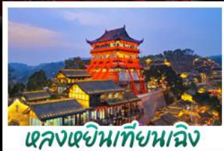
หลงหยินเทียนเจิง