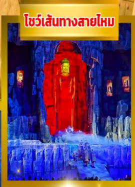
โชว์เส้นทางสายไหม