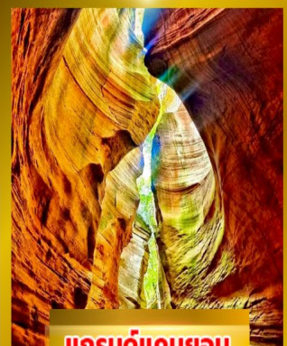
แกรนด์แคนยอน ยูวาโก