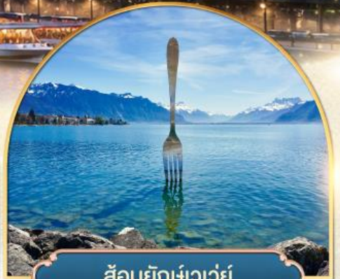
ส้อมยักเขวเว่ย