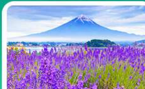
สวนโออิชิปาร์ก