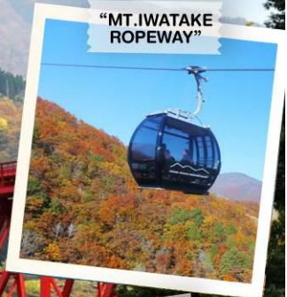
"MT. IWATAKE ROPEWAY"