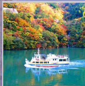
"SHOGAWA YURAN CRUISE"