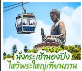
เน็กระเซ้าเองปิง ใจพระใหญ่เทียบทาน