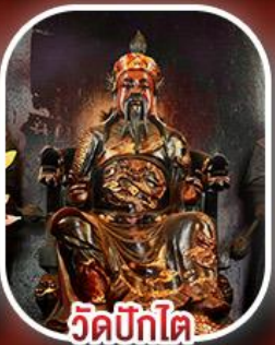
วัดปิกไต่