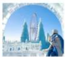
ICE & SNOW FEST.