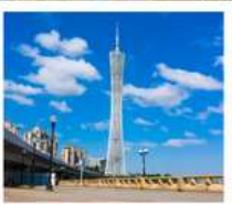
จัตุรัสฮัวเจิง