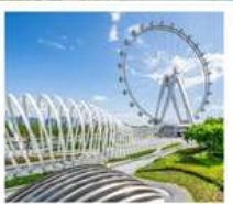
สวนสาธารณะ: OH BAY