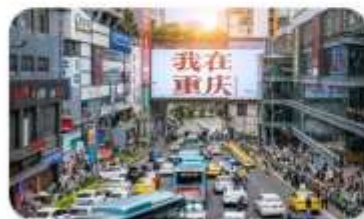
ถนนอาหารถวนอันเฉียว