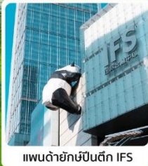
แพนด้ายักษ์บนตึก IFS