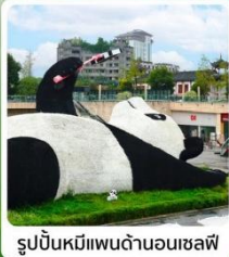
รูปปั้นหมีแพนด้าบนถนนเซฟ