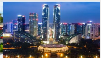
ตึกแฝดเจียงตุ

*ทางบริษัทฯ ขอสงวนสิทธิ์ในการสลับโปรแกรมทัวร์ตามความเหมาะสมขึ้นอยู่กับสถานการณ์หน้างาน โดยคำนึงถึงผลประโยชน์ของลูกค้าเป็นสำคัญ